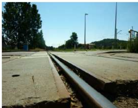
Zdjęcia 1-6 Przejazd kolejowy na ul. Gniewowskiej w Redzie przed projektem.